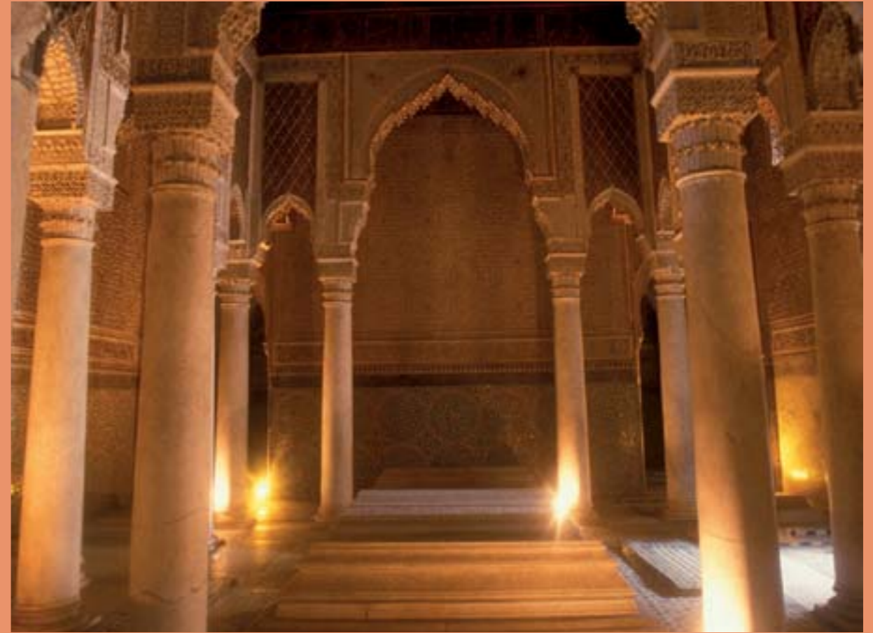
les Tombeaux Saadiens sont une magnifique nécropole royale où sont inhumés les principaux monarques de la dynastie