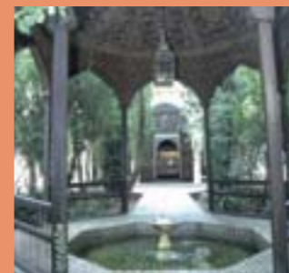
Le musée Dar Si-Said

La médersa Ben Youssef, édifice saâdien, véritable joyau de marbre, stuc, mosaïque et bois de cèdre est une grande université coranique qui attira des étudiants de tout le monde musulman. En face, la Koubba Almoravide (ou Koubba Ba'Adiyn) est le seul vestige des Almoravides (1064) et de leur architecture. Tout proche, le palais M'Nebhi, superbement restauré, accueille aujourd'hui le Musée de Marrakech et ses expositions autour de l'art contemporain et du patrimoine culturel marocain.