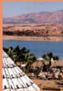
Aux bords du lac Lalla Takerkoust