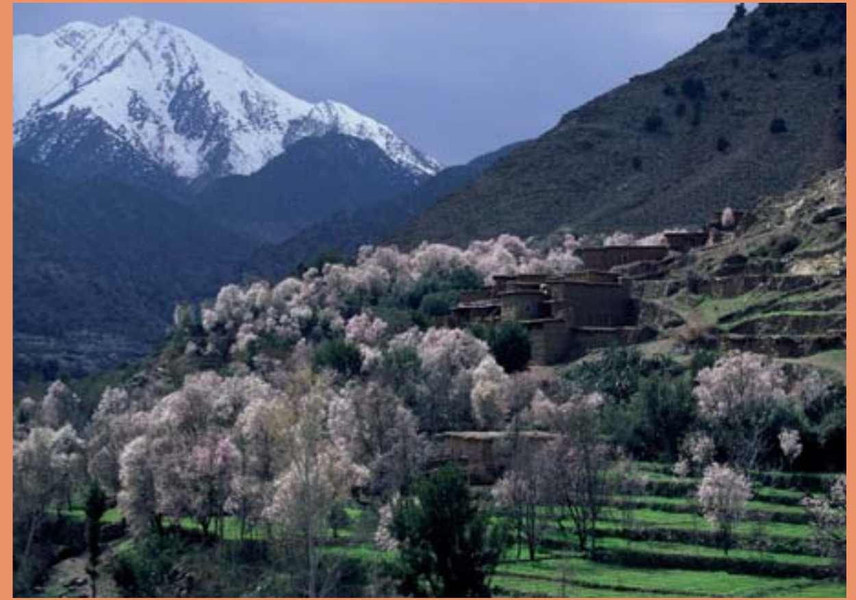
Village berbère, dans la vallée de l'Ourika

une belle vallée verdoyante avec ses villages en pisé accrochés à flanc de montagne. Dans le village de Tnine-de-l'Ourika, le Jardin du Safran est une ferme safranière qui se visite. Un peu plus loin, les jardins bioaromatiques cultivent 45 variétés de plantes aromatiques et médicinales que l'on peut sentir mais aussi goûter. Le jardin de Timalizene, tout en terrasses, vous propose aussi son thé berbère aromatisé aux herbes du jardin. Au fond de la vallée, on arrive à Setti-Fatma où s'arrête la route. Les plus courageux continueront à pied à la découverte des 7 cascades.