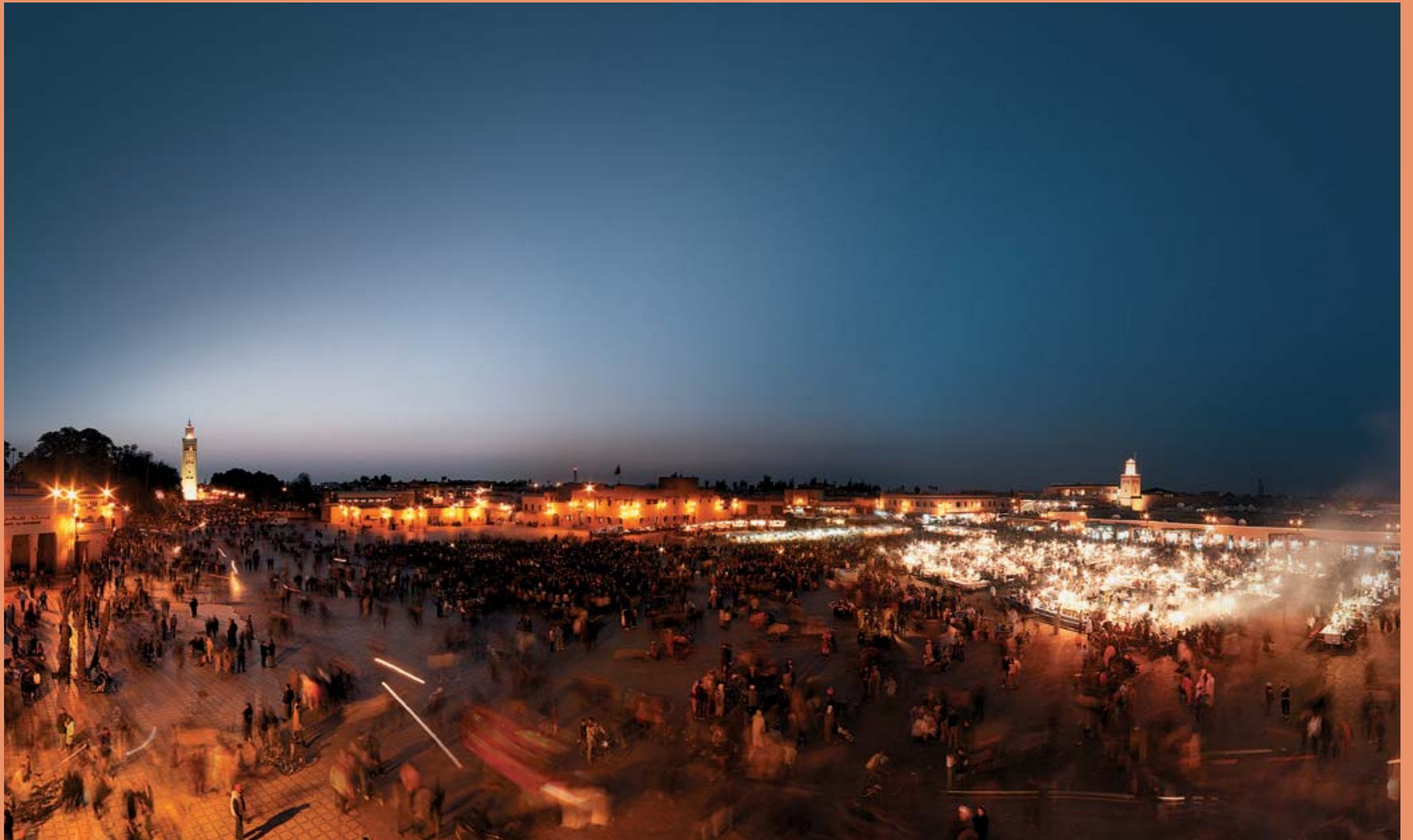
Quand le soleil se couche, Jemaa el Fna s'éveille