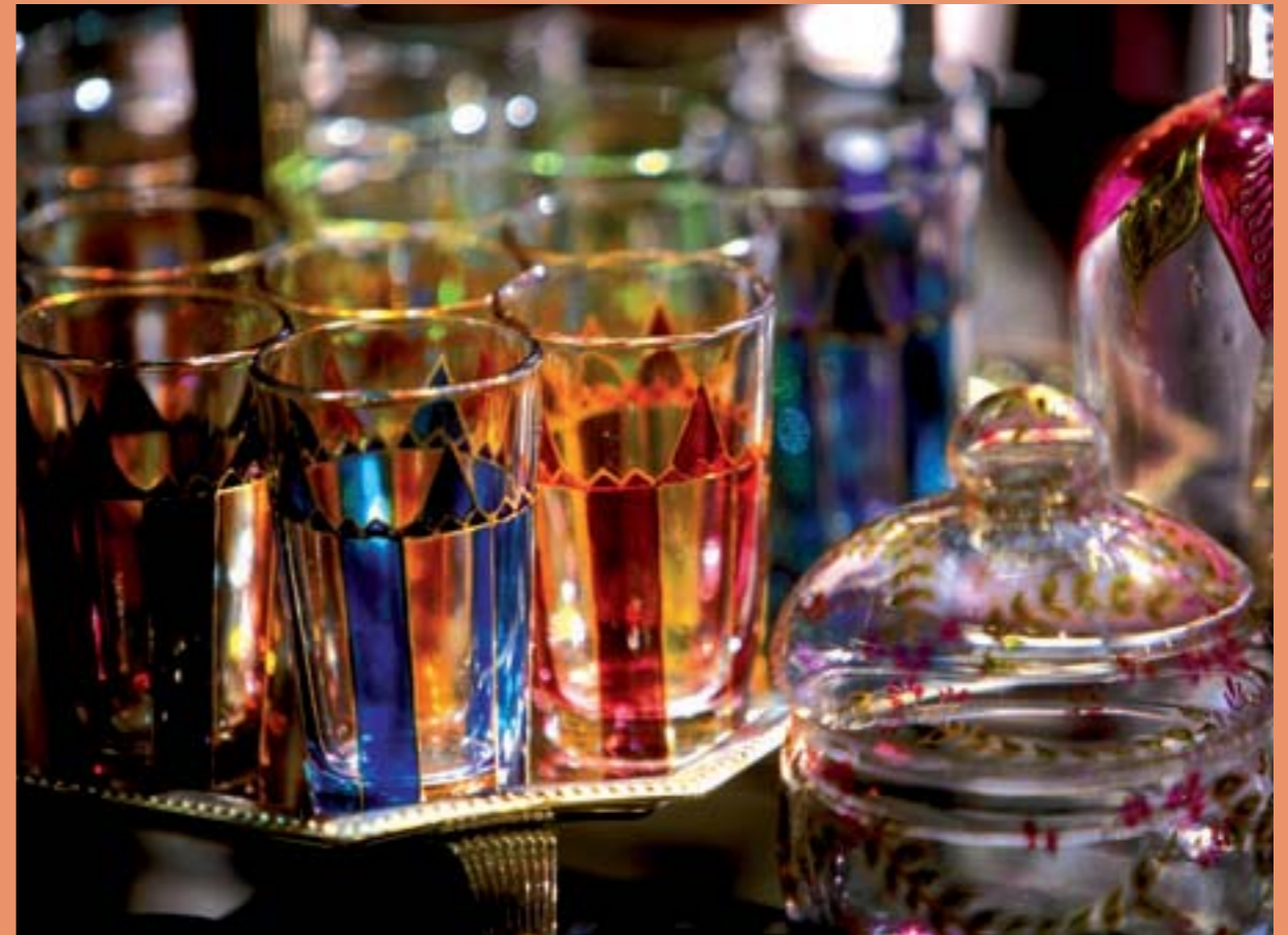
L'artisanat marocain perpétue un savoir faire, symbole d'une culture vivante