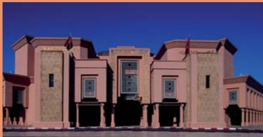
Le palais des congrès dispose de 17 salles de réunion avec différentes possibilités d'aménagement et différentes capacités

espaces verts, aussi bien dans la ville nouvelle que dans l'enceinte des remparts. Le jardin Majorelle, le parc Arsat Moulay Abdessalam, les jardins du Palais Bahia, les vergers de la Ménara et de l'Agdal sont, chacun dans leur style, autant d'endroits de quiétude, de détente et de ravissement.