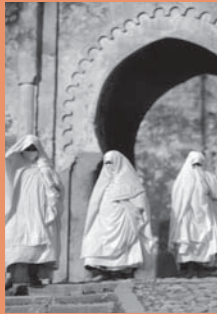
Marrakech, mille ans d'histoire...

Millénaire, la ville a vu se succéder 5 dynasties qui ont fortement influencé son destin. Ce sont les Almoravides qui fondent Marrakech en 1062. Leur plus bel héritage est d'avoir apporté l'eau à la ville grâce à un système ingénieux de puits, de captage de sources et de réseaux de canalisations. On leur doit la palmeraie, les jardins, les vergers et tout ce qui a permis le développement et le rayonnement de Marrakech. La ville est alors la capitale du Maroc.