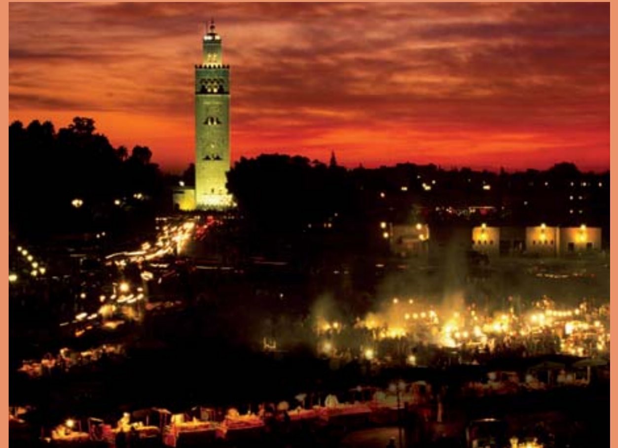
Marrakech : ville flamboyante