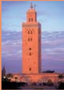
La Koutoubia, le «phare» de Marrakech...

La plupart des endroits «incontournables» se trouvent dans l'enceinte de la ville ancienne. La Koutoubia, la place Jemaa el Fna et la Ménara sont les lieux symboliques de Marrakech.