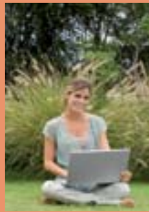
Des parcs ouverts sur le monde