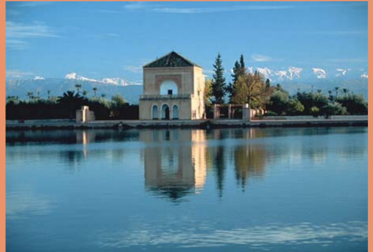
La Ménara inspire le calme, la paix, la méditation

Pour trouver calme et paix, les jardins de la Ménara sont un lieu magique. Les Almohades y ont érigé un harmonieux pavillon au XIX ème siècle, qui se reflète sur fond de Haut-Atlas dans un grand bassin d'eau entouré d'un vaste jardin planté d'oliviers. Le soir, il prend de magnifiques teintes dorées. Le bassin, réservoir pour l'irrigation de l'oliveraie, est alimenté par un système hydraulique qui, depuis 700 ans, capte l'eau des montagnes et l'achemine sur 30 km.