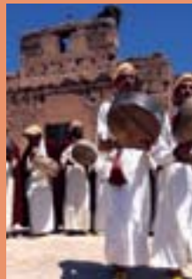
Le festival des arts populaires

Accueil princier à Marrakech Palaces de rêve, hôtels, riads, la féerie de Marrakech prend sa première signification dans ces établissements qui bénéficient de toutes les infrastructures modernes et de qualité, mais qui permettent surtout au visiteur de s'immerger dans la culture locale.