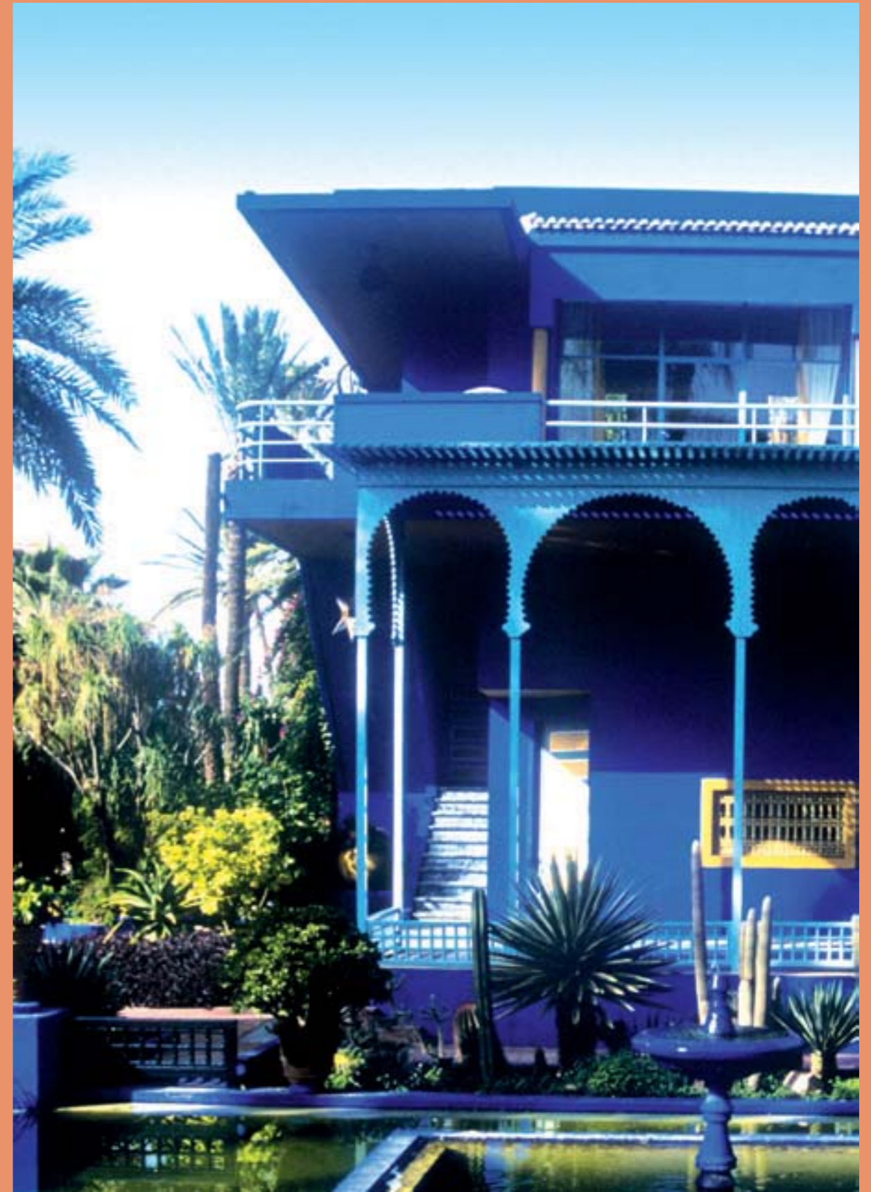
Le jardin Majorelle

Ce site enchanteur fut créé par le peintre français Jacques Majorelle qui s'y établit en 1922. C'est une symphonie de lumières et de couleurs, de fleurs et de végétation exotique, de chants d'oiseaux et de jets d'eau. L'artiste peignit les murs de sa villa d'architecture Art déco et le jardin d'un bleu outremer à la fois intense et lumineux. Ce jardin bleu dans la ville rose en étonna plus d'un. C'est pourtant le bleu du ciel de Marrakech ! Aujourd'hui propriété de la Fondation Pierre Bergé-Yves Saint-Laurent, le jardin Majorelle accueille le musée d'art islamique et les cendres du célèbre couturier qui y repose.