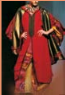
Le caftan marocain inspire les plus grands couturiers

Pour avoir une idée de la richesse de l'artisanat marrakchi et vous rendre compte du savoir-faire de ses artisans, rien ne vaut une balade dans les souks de la médina, parmi les plus réputés du Maroc pour leur diversité et l'ambiance extrêmement vivante qui y règne. Ces souks sont organisés en corporations: souk Cherratine pour la maroquinerie, Zrabi pour les tapis, Fekharine pour les poteries, Sebbaghine pour les teinturiers, Seffarine pour les cuivres... Le «mâalem», artisan expérimenté, est le gardien du savoir-faire ancestral et des secrets du métier.