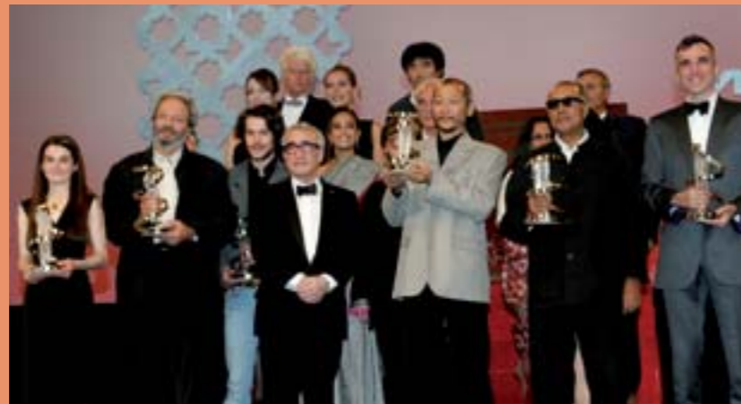
Le festival international du Film de Marrakech

Les fêtes de Marrakech Festival International du Film, Festival des Arts Populaires, Festival de la magie, Festival du Rire, Soirée «Caftan»... On ne compte plus les événements qui ont choisi Marrakech pour rayonner. Quelle que soit la période de l'année, vous pouvez être certains de trouver de l'animation et l'occasion de faire la fête dans les rues de Marrakech.